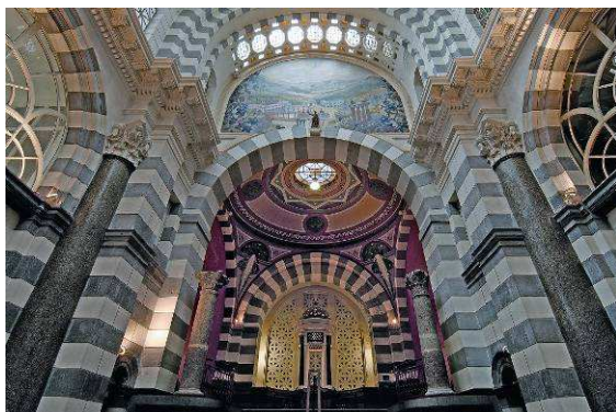
Les Thermes du Mont-Dore (classés MH)

A 6 km de La Bourboule, Le Mont-Dore est l'unique commune de la Route des Villes d'Eaux du Massif Central à bénéficier du double statut de Ville d'Eaux et de station de ski. Les thermes proposent ainsi des forfaits « bien-être » à savourer l'hiver après le ski ou l'été après la randonnée !