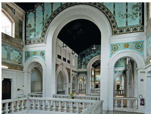
Les thermes de Bourbon-l'Archambault (03) – (classés MH)