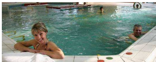
L'espace Vitalys du Centre de Bien-Etre Celtô

A travers 3 espaces (Vitalys, Aqualia et Nymphéa) , le Centre de Bien-Être Celtô, ouvert en 2007, offre une gamme de prestations bien-être pour le moins complète à base de détente en piscine d'eau thermale, soins à l'eau thermale, et soins esthétiques à base de cosmétiques Bio (Couleur Caramel, Lavera...).