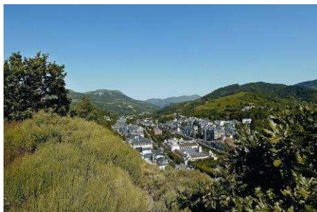
La Bourboule (63)

A une soixantaine de kilomètres au sud de Clermont-Ferrand, dans le Massif du Sancy où les volcans sont nés il y a trois millions d'années, Saint-Nectaire, La Bourboule, et le Mont-Dore sont un paradis pour les amateurs de grands espaces et de randonnées... mais également pour les skieurs grâce à leurs forfaits alliant activités de neige et bien-être !