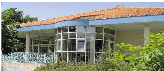
L'Institut Bien-Etre de Châtel-Guyon

Au sud de l'Allier, on entre dans le territoire volcanique de la Chaîne des Puys. Situées de part et d'autre de l'agglomération Clermontoise, Châtel-Guyon et Royat-Chamalières mettent à profit les ressources locales pour des soins originaux et innovants.