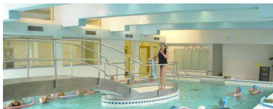
La nouvelle piscine en eau thermale

Tous les samedis après-midi à partir de 14h30, les thermes de Bourbon-l'Archambault vous offrent la possibilité, sur réservation, de profiter de 30 minutes de gymnastique en piscine, suivies d'une séance de 10 minutes de douches sous immersion dans la toute nouvelle piscine des thermes. A partir de 12 €