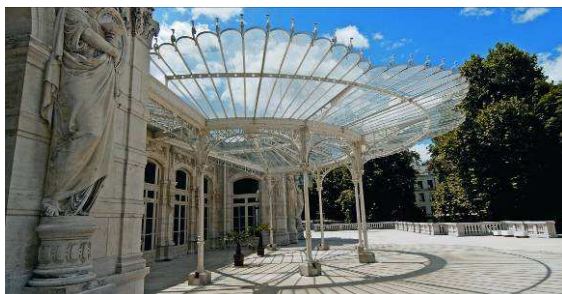
La marquise du Palais des Congrès - Opéra de Vichy

Reine des Villes d'Eaux au temps où Napoléon III y avait ses habitudes, Vichy possède aujourd'hui le patrimoine thermal le plus remarquable de tout le Massif central. Avec les Thermes des Dômes et le Vichy Thermal Spa Les Célestins, la ville offre aux amateurs de bien-être thermal le luxe de choisir entre des thermes néo-mauresques et un thermal spa ultra-moderne.