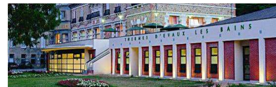
Le site thermal d'Evaux-les-Bains

Au printemps 2010, un tout nouvel espace bien-être ouvrira ses portes à Evaux-les-Bains. Situé au rez-de-chaussée du Grand Hôtel Thermal**, ce centre comprendra tout à la fois des cabines de soins esthétiques, de remise en forme à l'eau thermale ainsi qu'un espace avec spa, sauna et hammam... sans oublier la piscine extérieure en eau thermale !