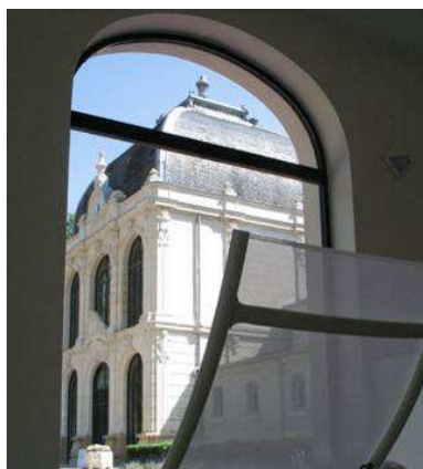
L'établissement thermal de Saint-Honoré-les-Bains

Dotés d'un spa thermal depuis 2008, les thermes de Saint-Honore-les-Bains – l'unique ville d'eaux de la Nièvre - offrent un authentique retour aux sources grâce à de nombreux forfaits découverte et/ou bien-être.