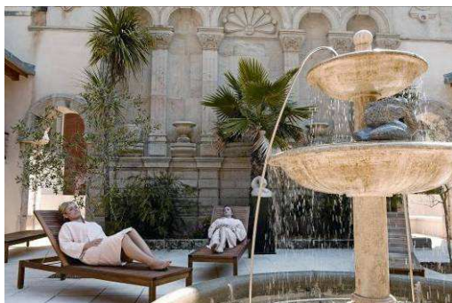
Le patio intérieur des thermes de Vals-les-Bains (07)

A quelques kilomètres de là, Vals-les-Bains est une Ville d'Eaux au petit air « Belle Epoque » située dans le pays d'Aubenas où vous aurez tout loisir à déambuler dans les petits marchés de pays au charme inimitable ou à flâner à une terrasse ensoleillée.