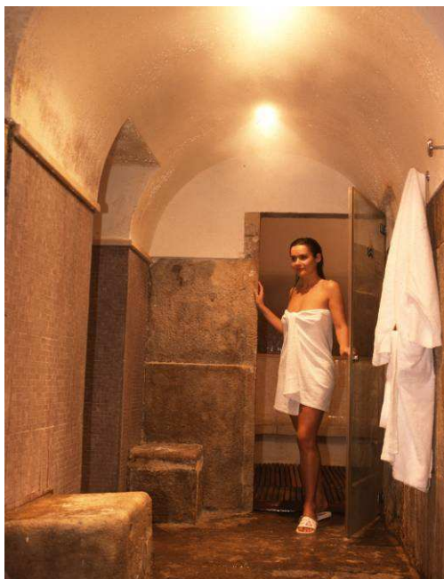
Le Centre Thermal de Bagnols-les-Bains (48)

A deux pas du Parc National des Cévennes et du Mont Lozère, Bagnols-les-Bains est un petit village de moyenne montagne traversé par le Lot et par de nombreux GR, ce qui en fait une destination idéale pour les amateurs de pêche et de loisirs de pleine nature. Sa proximité avec les gorges du Tarn et de la Jonte lui offre en outre un (très) large panel d'activités touristiques à proposer aux visiteurs.