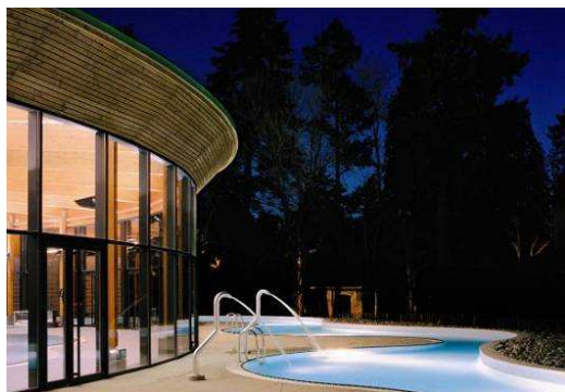
La rivière extérieure des Iléades

Unique station thermale de la Loire, celle que l'on a longtemps dénommé simplement « Montrond », en référence à la butte sur laquelle trône le château fort de la cité depuis le XI ème siècle, est une petite Ville d'Eaux en perpétuel mouvement. En 2009, elle a ainsi vu l'ouverture des Iléades, un immense Spa Thermal comprenant notamment 300 m 2 de bassins et un institut de bien-être attenant.