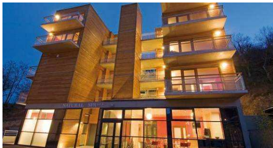
Le Natural Spa*** : 24 studios*** avec accès direct au spa

Au cœur du Pays des Jeunes Volcans d'Ardèche, le village historique de Meyras vous entraîne dans un dédale de ruelles au charme d'un autre temps. De l'autre côté de la vallée, la station contemporaine de Neyrac-les-Bains vous accueille dans un cadre magnifique, au sein d'un maar (cratère) où vous bénéficierez d'un environnement particulièrement agréable pour prendre soin de vous.