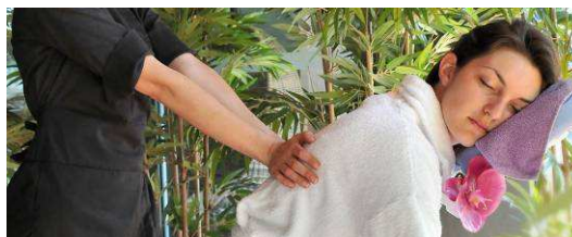
Modelage Amma Assis (15 min, 15€)

Rapide, efficace et réalisable partout, le amma assis est un modelage très chorégraphié. Il se pratique habillé et se regarde comme un spectacle. Modelage anti-stress par excellence, il favorise la concentration.