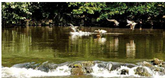
La rivière Sioule