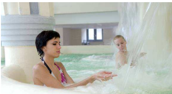
Le centre thermoludique Caleden (15)

Au sud de l'Auvergne, on arrive dans le Cantal, le fief de Chaudes-Aigues. La cité doit son nom à la chaleur de ses eaux, dont celle de la source du Par qui, avec 82°C à l'émergence, est réputée pour être la plus chaude d'Europe. Avec ses toits de lauze, Chaudes-Aigues ressemble à un village de carte postale, niché entre les Monts du Cantal, de la Margeride et de l'Aubrac.