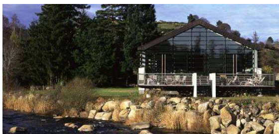
Le Centre Thermal de La Chaldette (48)