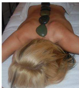
Modelage aux pierres chaudes au Pavillon César

Spécialisée dans le traitement du mal de dos et du stress grâce à des eaux riches en Lithium, Nérís-les-Bains propose tout une gamme de forfaits et de soins de remise en forme particulièrement appréciés des urbains stressés !