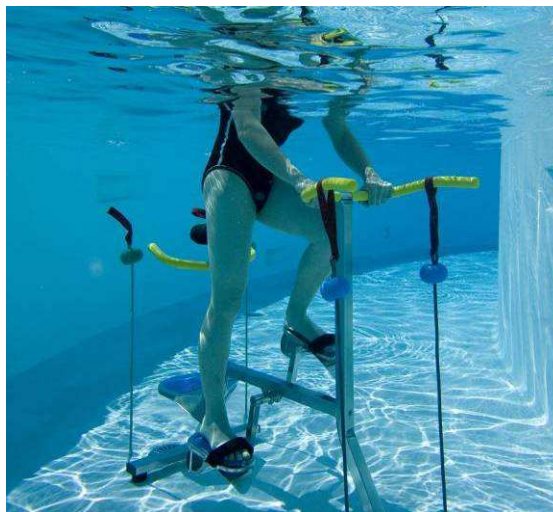
Le Cardi'Eau Bike

Exercices : Travail aérobic (pédalage et step), travail des jambes, des épaules et des bras