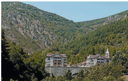
Les Thermes et la station de Saint-Laurent-les-Bains (07)

A deux pas de la Lozère, Saint-Laurent-les-Bains est une petite station de la Montagne Ardéchoise, perchée dans un décor exceptionnel. Reconstitués en 1997, les thermes offrent un panorama imprenable sur la vallée de la Borne.